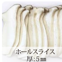
ホールスライス 厚:5mm