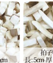
拍子切り 長:5cm 厚:8mm×8mm