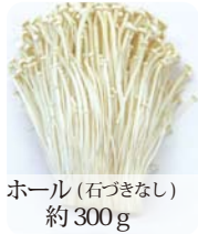
ホール(石づきなし) 約300g