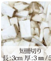
短冊切り 長:3cm 厚:3mm/5mm