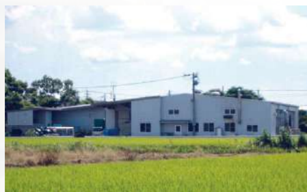
本社工場(栽培工場) 〒830-0424 福岡県三潞郡大木町三八松465 TEL 0944-75-2525 FAX 0944-75-2535 敷地面積 2,658㎡ 取得認証 JGAP青果物